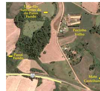
Imagem de satélite do Povinho Velho, berço de quatro bacias hidrográficas

* A população atingida não corresponde ao número total de habitantes dos municípios de abrangência, já que a bacia hidrográfica muitas vezes não compreende todo o território municipal. A bacia do rio Passo Fundo, por exemplo, contempla cerca de 40% da área do município.