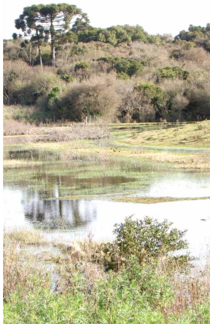
Esse banhado é originado por uma das nascentes mãe do rio Passo Fundo

Recursos hídricos: município é berço de nascentes que abastecem cinco bacias hidrográficas, atingindo 302 municípios dos 496 do Estado. ON faz um resgate histórico e revela que esse potencial hídrico pode estar ameaçado, assim como as águas do rio que dá nome à cidade