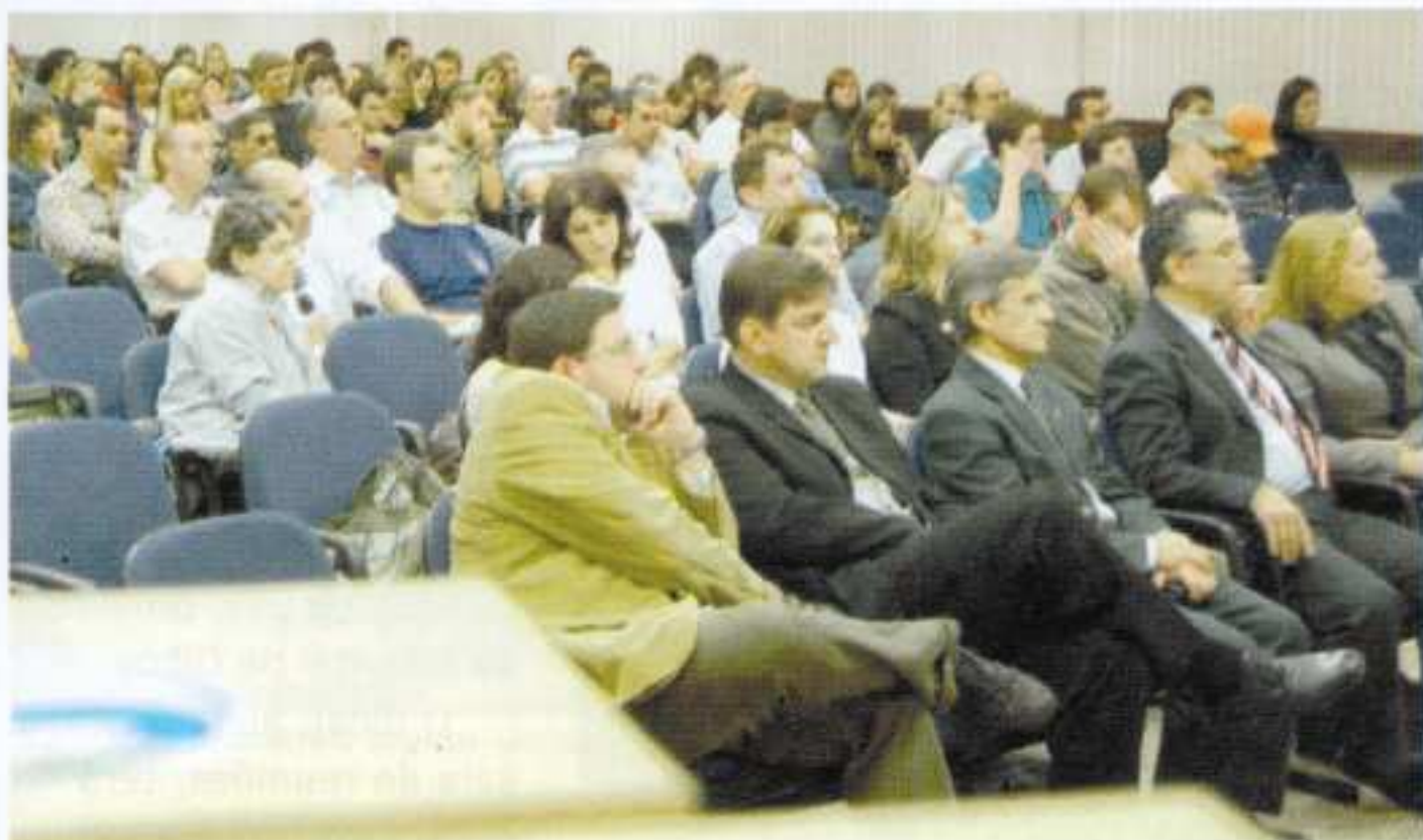
MAIS DE 200 PESSOAS PARTICIPARAM DO 1º SEMINÁRIO REGIONAL SOBRE OS USOS MÚLTIPLOS DA ÁGUA

A UPF sediou, em abril, o 1º Seminário Regional sobre a Gestão Integrada de Recursos Hídricos. O evento debateu os principais temas e problemas relacionados com o uso da água pelos setores do abastecimento público, esgotamento sanitário, indústria, geração de energia, mineração, pecuária e agricultura.